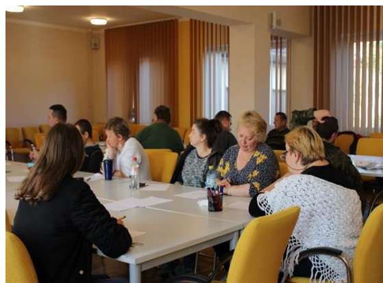
Fot. 1 i 2. Zajęcia z reintegracji społecznej w CIS Siedlce.

3. Fachowa reintegracja zawodowa – umożliwienie stworzenia takich warunków w CIS, jakie panują na otwartym rynku pracy oraz odpowiadają zapotrzebowaniu lokalnych pracodawców. Siedleckie Centrum prowadzi 7 sekcji zawodowych, w tym od 15 lat sekcję krawiecko-szwalniczą. Obecnie, aby móc dostosować park maszynowy do obowiązujących standardów, jak również zapewnić dalszy rozwój sekcji, niezbędny jest zakup maszyn szwalniczych oraz zakup wyposażenia, które przewidziano w ramach realizacji zadania. Warto dodać, że w okresie pandemii sekcja krawiecko-szwalnicza aktywnie włączyła się w akcję szycia maseczek (ponad 15 tysięcy sztuk) ale też wspiera siedlecki DPS (usługi szwalnicze i krawieckie). W ramach działania zaplanowano również szkolenie dot. sprzedaży internetowej i związanej z tym obsługi klienta. Będzie ono odpowiedzią na zapotrzebowanie lokalnego