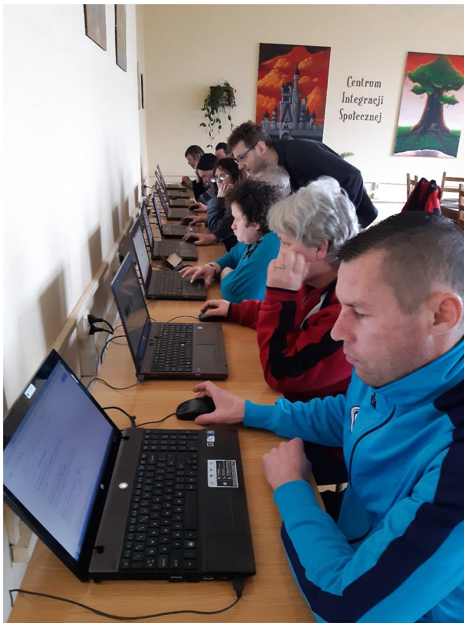
Fot. Kurs komputerowy – wszystkich „wciągnął” internet.

Równocześnie prowadzona jest reintegracja społeczna poprzez warsztaty społeczno-zawodowe i spotkania grup wsparcia. Okres jesienno-zimowy jest tym czasem, w którym intensywniej odbywają się wszelkiego rodzaju szkolenia i warsztaty oraz kursy zawodowe.