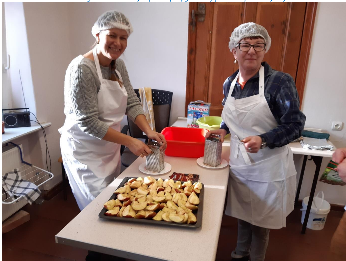
Fot. Kurs gastronomiczny – panie przygotowują deser z pieczonych jabłek