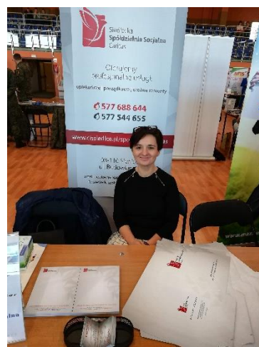
Fot. 3. Rynek Pracy – spotkanie rekrutacyjne dla Absolwentów CIS.

Podsumowując, projekt zakłada zwiększenie skali usamodzielnienia ekonomicznego absolwentów CIS poprzez podniesienie fachowości: