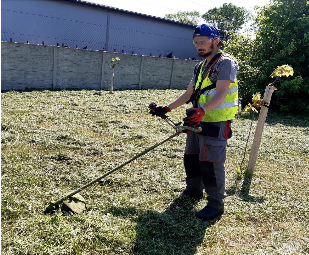
Fot. ...i kosiarz w pełnym rynsztunku

Dbłość o rozwój zawodowy uczestników CIS przejawia się także w realizacji różnego rodzaju kursów zawodowych. Uczestnicy CIS mieli okazję zdobyć m.in kwalifikacje jako operator pilarek mechanicznych do ścinki drzew, uzyskać uprawnienia palacza CO, uprawnienia elektroenergetyczne do 1 KW, podnieść swoje zdolności kulinarne na kursach gastronomicznych, czy zyskać kompetencje cyfrowe na kursach komputerowych.