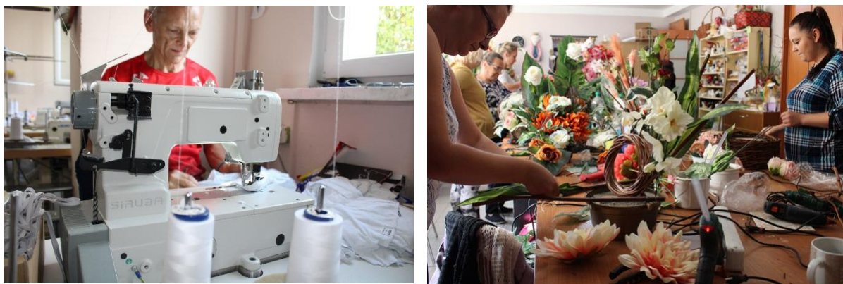
Fot. 1 i 2. Zajęcia z reintegracji zawodowej w CIS Siedlce.

rynku pracy (wielu pracodawców zgłasza zapotrzebowanie na tego rodzaju kompetencje wśród swoich potencjalnych pracowników). Poza tym w ramach, wcześniej wspomnianego projektu „Kompleksowa odnowa społeczno-zawodowa z Centrum Integracji Społecznej w Siedlcach” został utworzony sklep internetowy CIS ( www.sklepccissiedlce.pl ) przez co będzie możliwość przeprowadzenia szkolenia zarówno w formie zajęć teoretycznych, jak i praktycznych.