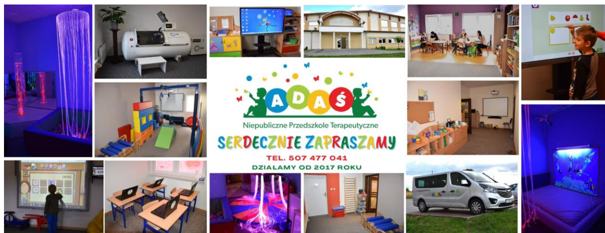
Fot. Przedszkole Adaś dysponuje nowoczesnym sprzętem m.in. salą doświadczenia świata, programem CyberOko

Placówka oferuje bezpłatną edukację w małych grupach . Dzieci korzystają także z sal doświadczenia świata i integracji sensorycznej. W przedszkolu prowadzone są różnorodne zajęcia: wczesne wspomaganie rozwoju, terapia ręki, rehabilitacje, CyberOko, logopedia, mobilna rekreacja muzyczna, terapie w sali doświadczenia świata, ziołoterapia oraz Metoda Ruchu Rozwijającego Weroniki Sherborn w formie zajęć grupowych.