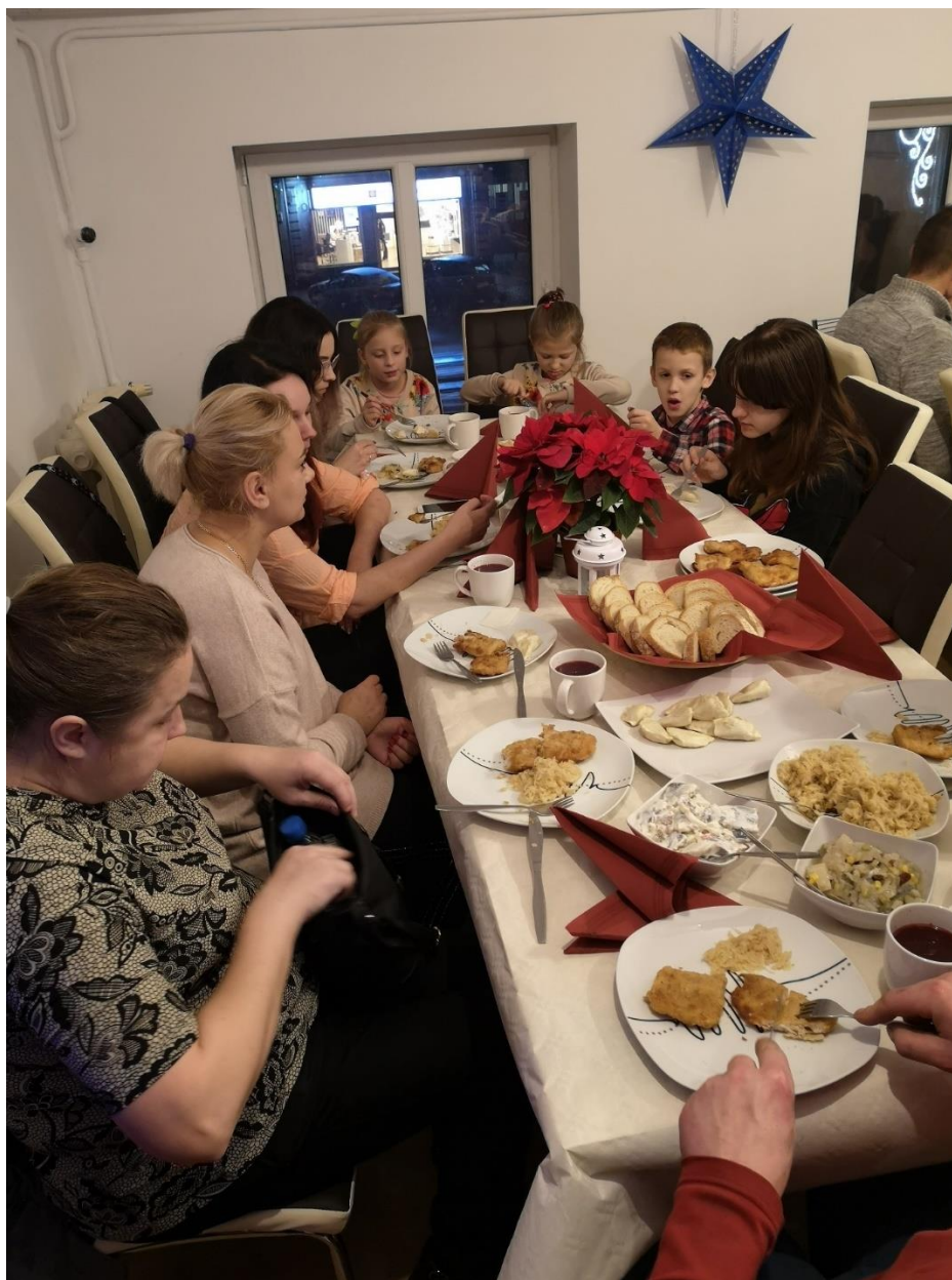
Fot. Spotkanie wigilijne rodzin

o działaniach w zakresie reintegracji społecznej i zawodowej. W realizacji Stowarzyszenie podejmuje różnorodne zadania dla wszystkich grup wiekowych. Wspólnym mianownikiem wszystkich działań jest praca na rzecz rodziny. W katalogu naszych realizacji są projekty promujące aktywizację całych rodzin (gry planszowe, lokalna turystyka rodzinna, zajęcia plastyczne, badminton, wyprawy turystyczne po okolicy: piesze i rowerowe, organizacja spotkań integracyjnych m.in. wigilii).