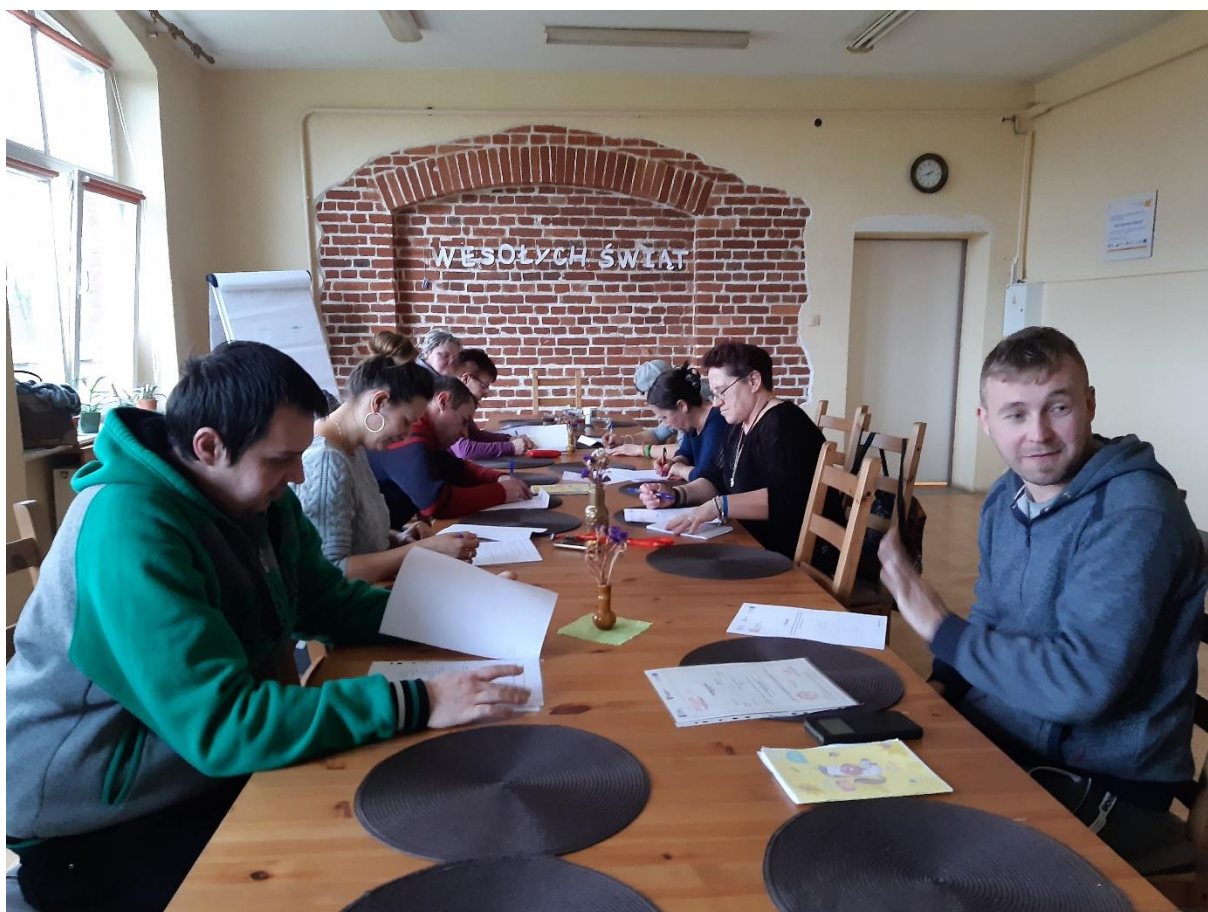
Fot. Warsztaty psychologiczne – dużo mówienia, ale też trochę pisania

Jedną z najważniejszych potrzeb bez której reintegracja w CIS nie mogłaby się w ogóle odbywać jest zapewnienie dojazdu osobom na zajęcia w CIS. Szczególnie intensywnie eksploatowany jest CIS-bus. Aby dowieźć ludzi na zajęcia do CIS w Róży Wielkiej bus musi pokonać dziennie ponad 200 km. Zapewnienie dojazdu na zajęcia pojazdem CIS likwiduje barierę komunikacyjną i finansową, co staje się zachętą do postawienia pierwszego kroku dla osób długotrwale nieaktywnych. Dzięki zapewnieniu transportu uczestników z miejsca zamieszkania i z powrotem naszym busem osoby z miejscowości wykluczonych komunikacyjnie mają szansę na udział w zajęciach CIS. Gmina Szydłowo jest bardzo rozległą terytorialnie gminą. Dzięki zapewnieniu transportu osoby z terenów wykluczonych komunikacyjnie (gdzie nie kursuje żaden publiczny transport) mogą regularnie uczestniczyć w zajęciach reintegracyjnych w CIS.