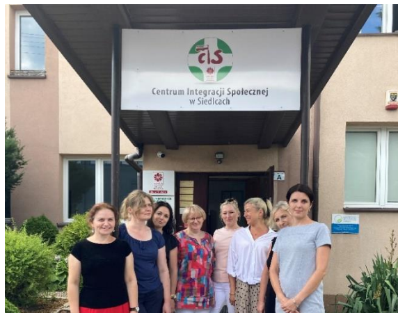
Fot. 1. Wyróżnienia Mazowiecką Marką Ekonomii Społecznej 2020 dla Centrum Integracji Społecznej w kategorii Reintegracja, Siedleckiej Spółdzielni Socjalnej Caritas i Fundacji Leny Grochowskiej w kategorii Rozwój oraz Miejskiego Ośrodka Pomocy Rodzinie w Siedlcach w kategorii Odpowiedzialność.