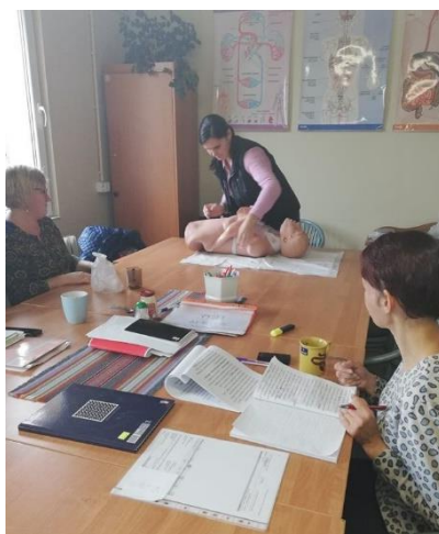
Fot. 2. Praktyki zawodowe w Spółdzielni.