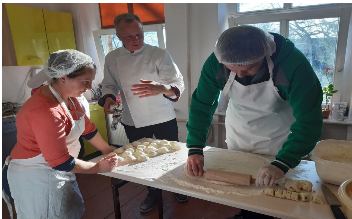
Fot. Kurs gastronomiczny – panowie wspaniale radzili sobie z przygotowaniem ciasta na pierogi.