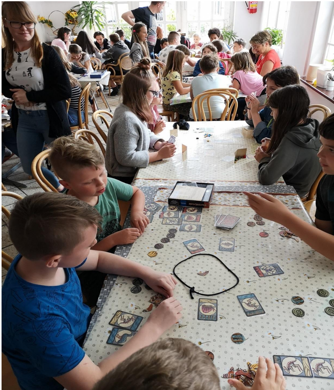
Fot. Zajęcia na koloniach – gry planszowe

Współpracując z ośrodkami pomocy społecznej z terenu województwa łódzkiego (Pabianice, Aleksandrów Łódzki, Konstancin Łódzki, Widawa) Stowarzyszenie dostrzega potrzebę kompleksowego wsparcia dzieci i młodzieży pochodzących z rodzin, które mają trudności w wypełnianiu funkcji opiekuńczo-wychowawczych oraz konieczność integrowania ich ze środowiskiem.