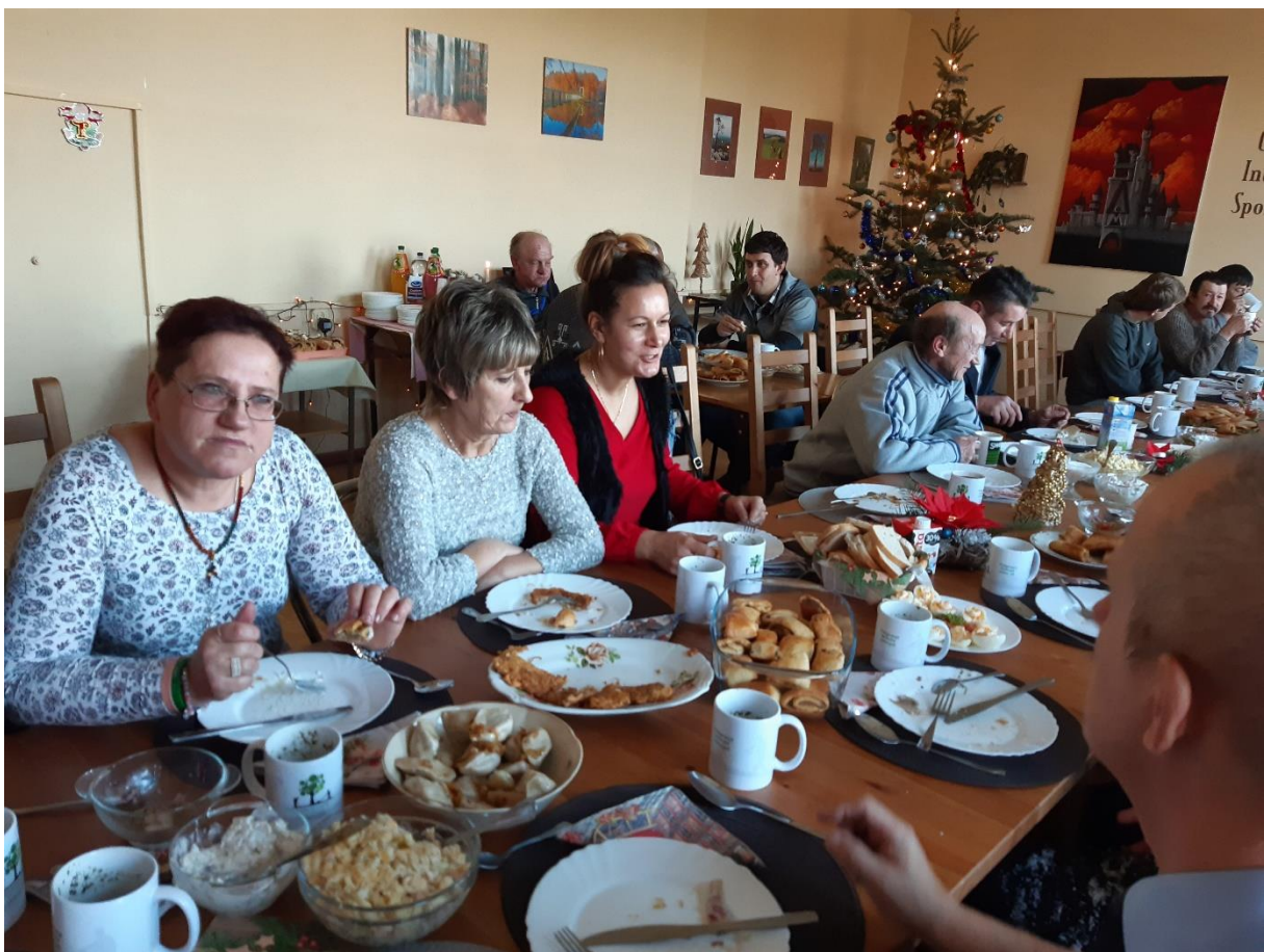
Fot. Wigilia 2019 – wszyscy tęsknili za czasem wspólnego posiłku i dzielenia się opłatkiem w grudniu 2020

Aktualnie w CIS w Róży Wielkiej działają cztery warsztaty zawodowe, w których uczestniczą łącznie 42 osoby. Zatrudnionych jest czterech instruktorów praktycznej nauki zawodu oraz psycholog/doradca zawodowy. Stało się to możliwe dzięki dotacjom, które CIS otrzymał z Ministerstwa Rodziny i Polityki Społecznej na realizację celów reintegracyjnych w 2021 roku – konkurs : „Od wykluczenia do aktywizacji”. W ramach zadania publicznego CIS