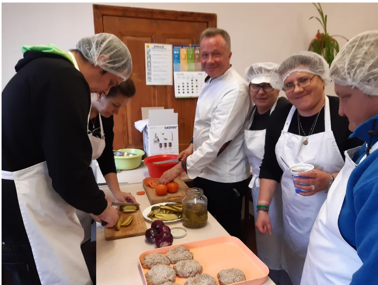
Fot. Kurs gastronomiczny – robimy CIS-Burgery.