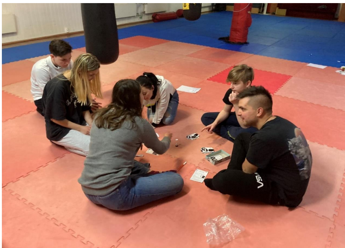
Fot. Gry planszowe w Klubie Aktywności Młodzieżowej

Nie unikamy pracy z tzw. „trudną” młodzieżą – chociaż głęboko nie zgadzamy się z takim określeniem. Młodzież to grupa, która jest podatna na oddziaływanie innych, a sama szuka autorytetów. W tym poszukiwaniu często błądzi, przechodzi fazę buntu i wtedy najbardziej potrzebuje dobrych wzorców. Dla nas każdy człowiek to olbrzymia wartość. Często pozwalamy sobie nazwać ich „młodymi gniewnymi” doceniając ich olbrzymi potencjał do aktywności, który trzeba tylko odkryć i uruchomić. Trochę pracujemy jak szlifierze diamentów i żaden kamień nie zostanie przez nas odrzucony, a odkrycie tego, co ukryte głęboko jest naszym największym sukcesem.