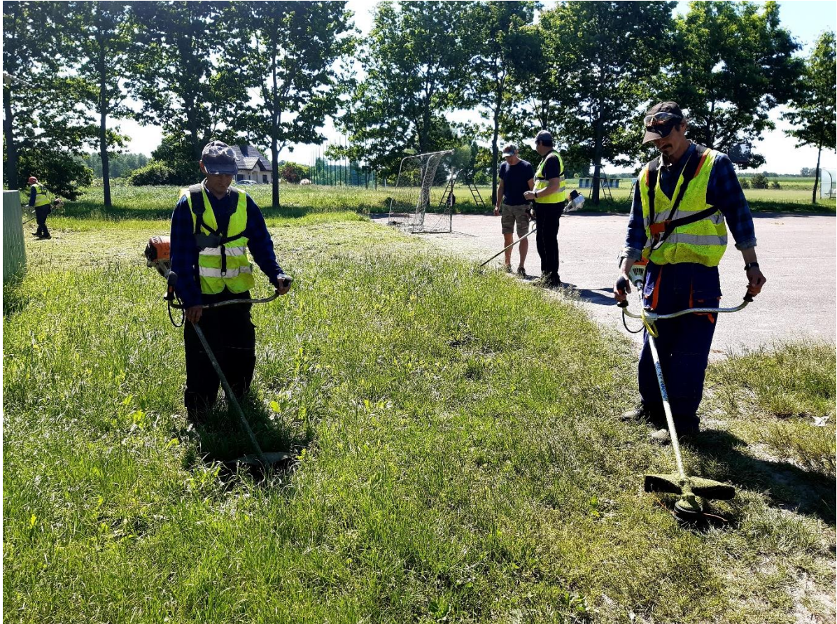
Fot. Grupa kosiarzy – gotowi do pracy.