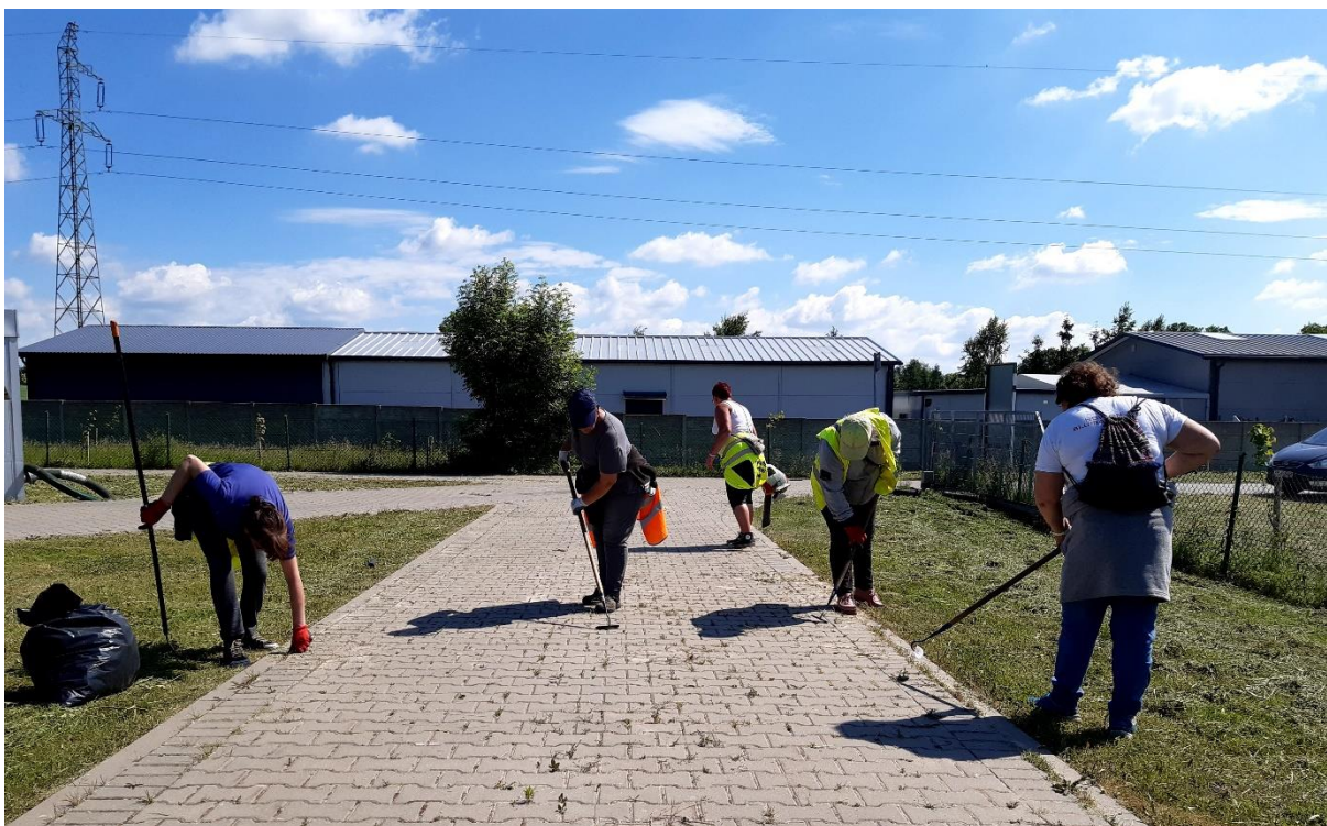
Fot. Grupa porządkowa czyści i odchwascza chodnik.

W sezonie wiosenno-letnio-jesiennym kosimy trawniki, skwery, boiska oraz prowadzimy prace porządkowe w poszczególnych miejscowościach na terenie gminy Szydłowo.