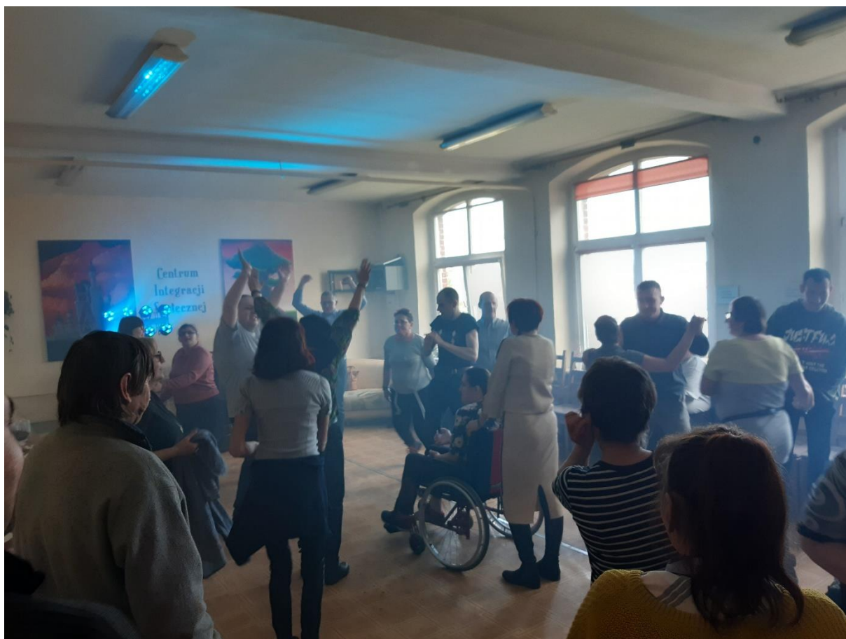
Fot. Bal karnawałowy 2020 z gośćmi z Warsztatów Terapii Zajęciowej w Leżnicy

zmotywować się do pracy, do zdobycia doświadczenia. Z naszą ofertą trafiamy więc do osób, które z powodu wewnętrznych barier psychologicznych długie lata pozostawali bez jakiegokolwiek konkretnego zajęcia, tkwili zamknięci i samotni w domach, pozbawieni szerszych relacji społecznych (lub zamknięci tylko w kręgu swoich domowników). Takim ludziom często trudno jest postawić pierwszy krok, brak im wiary we własne siły, trudno im dostrzec potencjalne szanse wyjścia z marazmu. Udział w zajęciach w CIS pomaga im stopniowo pokonywać swoje „niewidzialne” ograniczenia.