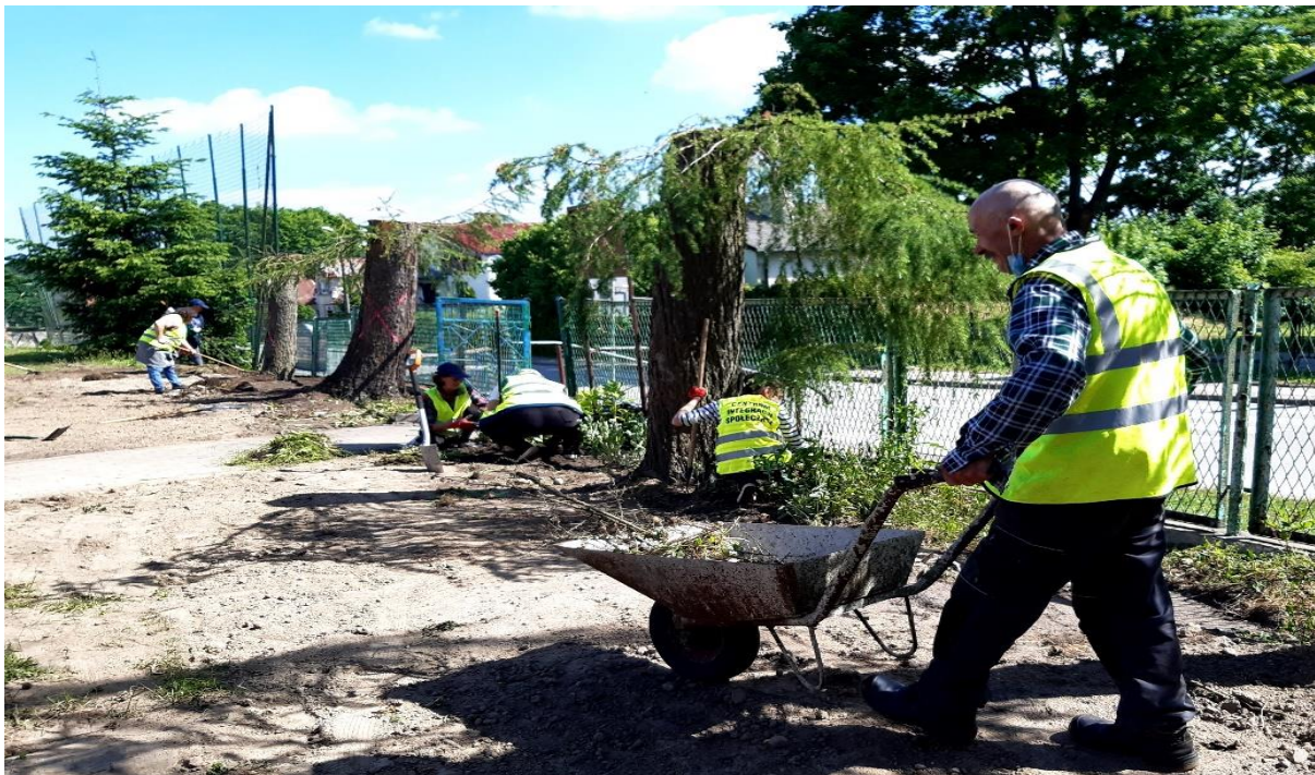
Fot. Uczestnicy CIS przygotowują teren pod założenie ogrodu różanego.