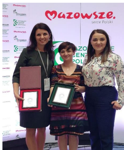
Fot. 1. Zarząd Siedleckiej Spółdzielni Socjalnej Caritas.

Realizacja działania będzie nieocenioną pomocą i wsparciem w zbudowaniu dobrych relacji opartych na zaufaniu, wzajemnym szacunku oraz współpracy. Pozwoli na skuteczne prowadzenie ścieżki reintegracji, zwiększając tym samym skalę usamodzielnienia ekonomicznego absolwentów CIS.