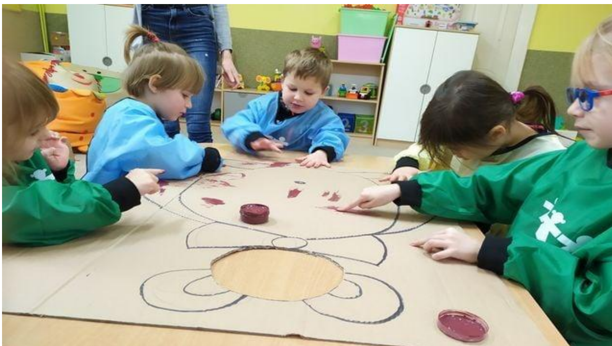
Fot. Przedszkole Terapeutyczne w Kowalewie Pomorskim ma w ofercie m.in. zajęcia sensoplastyczne i arteterapię

Również ta placówka zyskała uznanie rodziców, doceniających indywidualne podejście do dziecka i fachowość kadry – przedszkole w Kowalewie Pomorskim jest laureatem plebiscytu Orły Edukacji. Fundacja jest również podmiotem certyfikowanym Znakiem Jakości Ekonomii Społecznej i Solidarnej 2020 w kategorii Debiut Roku.