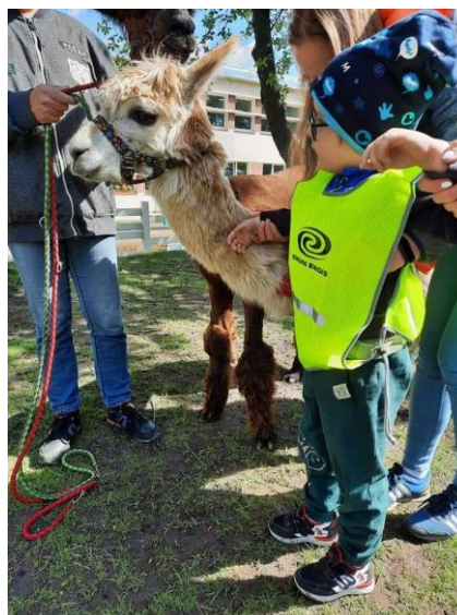
Fot. Przedszkole Jedno Słońce to pierwsza tego rodzaju placówka w powiecie wąbrzeskim

Przedszkole ściśle współpracuje z rodzicami, tak by praca rozpoczęta przez terapeutów w przedszkolu była także kontynuowana w domu. Przedszkole zapewnia doświadczoną i profesjonalną kadrę pedagogiczną, wszechstronnie wyposażone sale dydaktyczne i terapeutyczne, zajęcia z wczesnego wspomagania rozwoju dziecka, terapię psychologiczną, pedagogiczną, logopedyczną, behawioralną, integracji sensorycznej, miodfunkcjonalną, trening umiejętności społecznych, terapię percepcji słuchowej, logorytmikę, bajkoterapię, terapię polisensoryczną, terapię ręki, zajęcia korekcyjno-kompensacyjne, rytmikę, sensoplastykę.