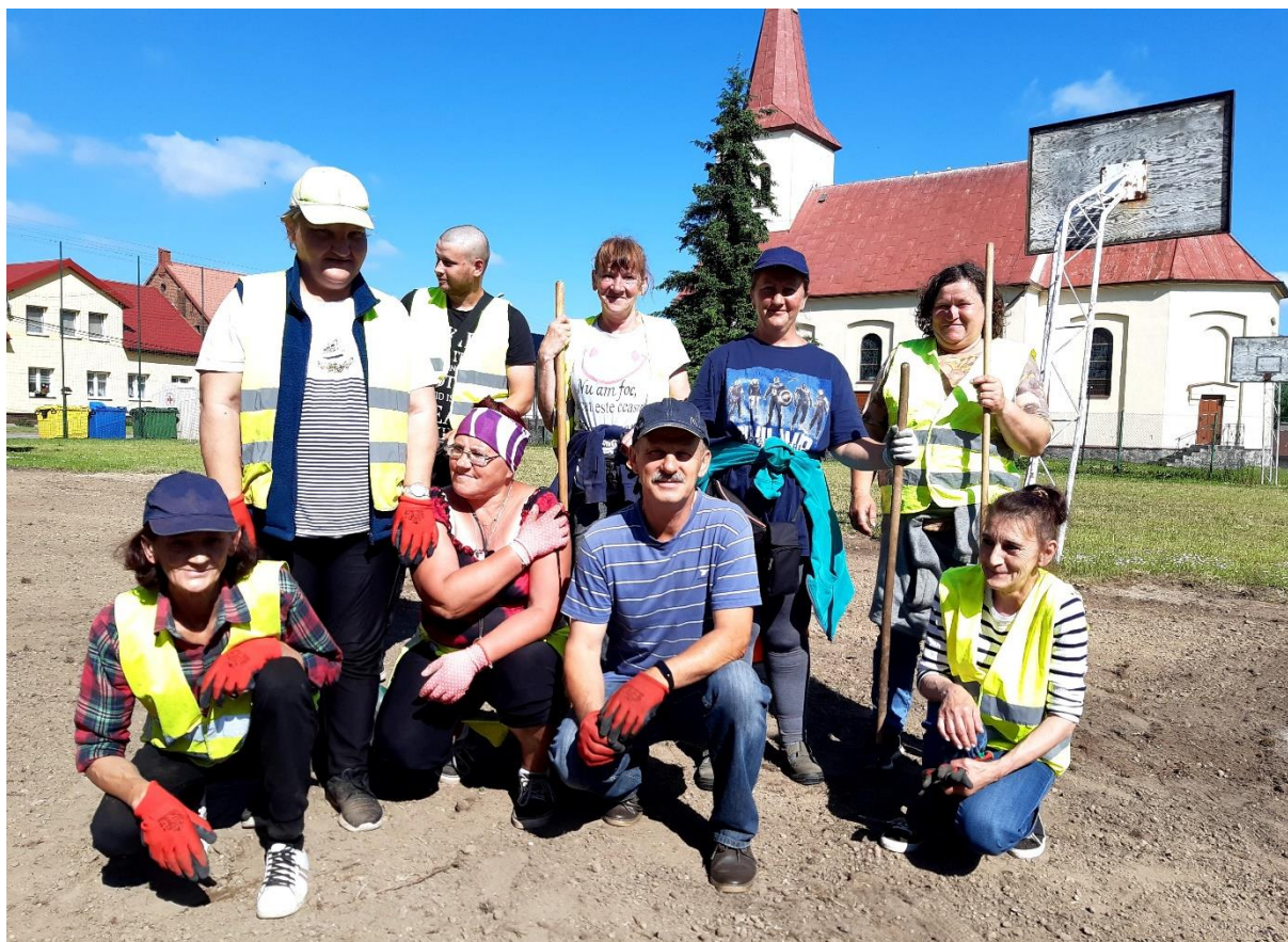
Fot. Uczestnicy CIS z instruktorem – jedna z grup porządkowych.

W północno-zachodnim zakątku Wielkopolski, na ziemiach, które przez setki lat były pograniczem polsko-niemieckim, leży Gmina Szydłowo (powiat pilski). Głównym atutem gminy jest malowniczy krajobraz, w którym rozległe pagórkowate tereny rolnicze przeplatają się z lasami. Po 1989 r. działające tu PGR-y zostały zlikwidowane a skutkiem tego była ogromna rzesza bezrobotnych byłych robotników rolnych. Powstające, przeważnie jednoosobowe nowe firmy nie były w stanie zagospodarować tak dużej liczby rąk do pracy.