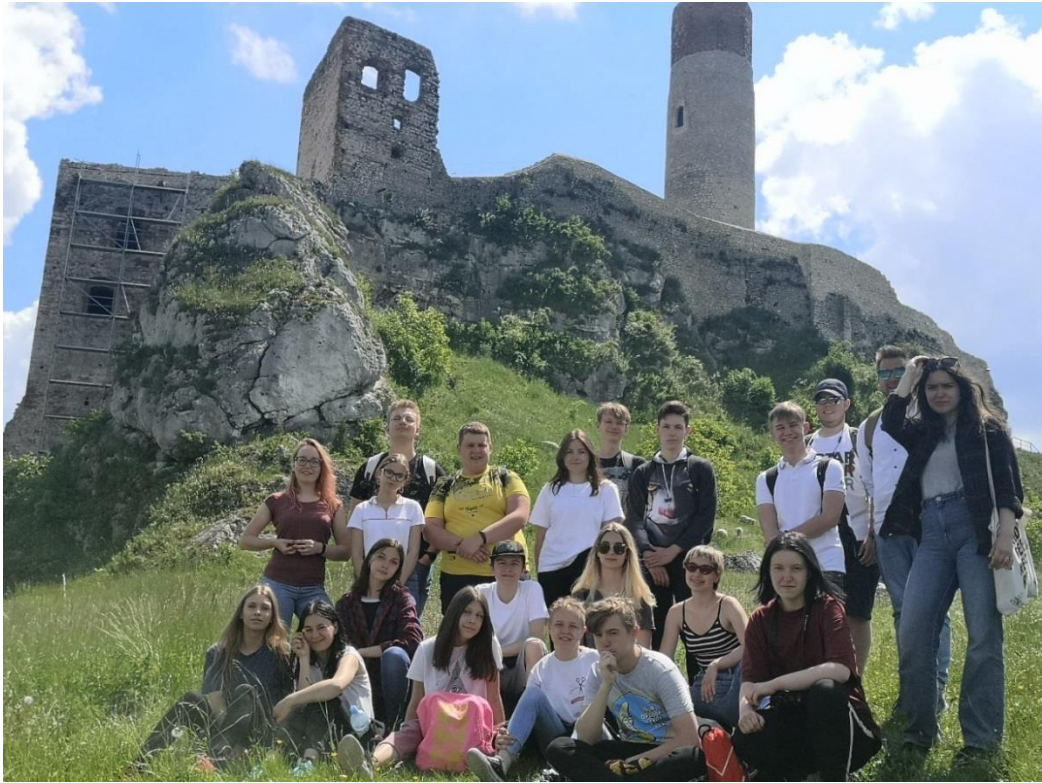
Fot. Młodzi, gniewni, ambitni – Klub Aktywności Młodzieżowej 20