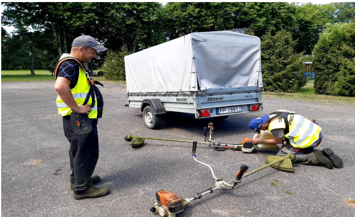
Fot. Przerwa w pracy - uzupełnianie paliwa do kosi.