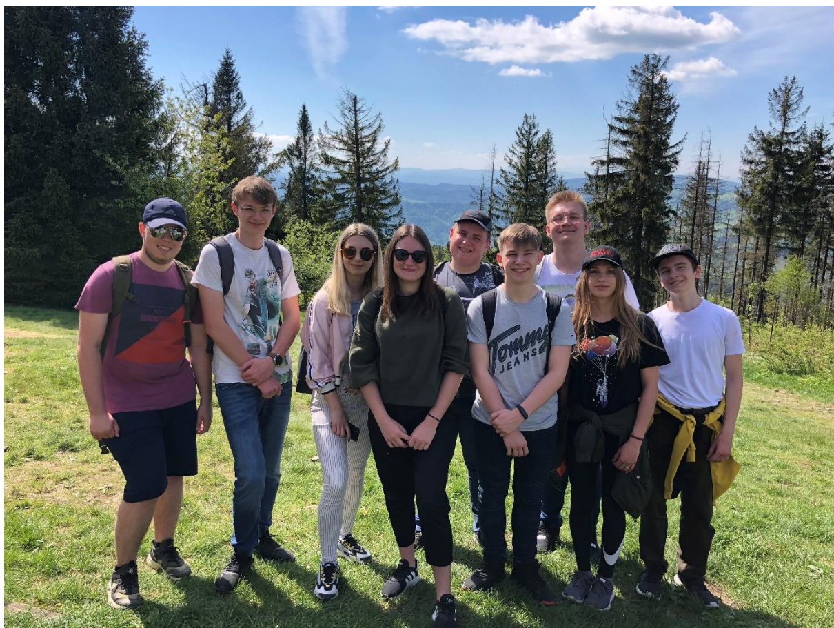
Fot. Młodzież z Klubu Aktywności Młodzieżowej w Beskidzie Śląskim

Projekt Klub Aktywności Młodzieżowej (współfinansowany przez Ministerstwo Rodziny i Polityki Społecznej) idealnie wpasowuje się w działania Oratorium i jest odpowiedzią na potrzeby wskazywane przez szkolnych pedagogów i pracowników socjalnych. Wspólny wyjazd, wsparcie specjalistów (pedagoga, psychologa, doradcy zawodowego) oraz różne formy spędzania wolnego czasu (gry planszowe, zajęcia plastyczne, wyprawy piesze i rajdy rowerowe, warsztaty muzealne) będą realnym wsparciem dla młodych ludzi. Integracja grupy zaowocuje podniesieniem poczucia własnej wartości, wzrostem motywacji i wiary we własne możliwości.