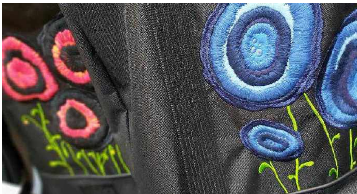
Ręcznie haftowane aplikacje kwiatowe na FURIATKACH

Dla marki UPNAP szyjemy kolorowe hamaki oraz inne produkty turystyczne – 1 czy nas potrzeba biznesowa, ale bardzo w tym elementem tej współpracy są wspólne wartości oraz wspólna pasja. Natomiast wykonywane u nas przypinki/buty/piny dla marki ASPIRACJE to małe, dekoracyjne i inspirujące realizacje, które pozwalają osobom w spektrum autyzmu opowiedzieć o sobie, stać się magicznymi nośnikami przekazu o potencjale tworzących je osób. Wśród naszych długoletnich partnerów jest również marka Szududu, dla której szyjemy stylowe kosmetyczki i torby dla aktywnych kobiet. Od 2018 roku Spółdzielnia FURIA realizuje również swój wymarzony projekt autorski: FURIATKA – to praktyczna torba w kilku designerskich odsłonach: „klasyczna” – czarna z kolorowymi podszewkami, „rozważna” – obszywana odblaskiem oraz „romantyczna” – dekorowana również haftowanymi aplikacjami kwiatowymi.