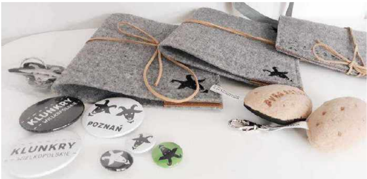
Klunkry Wielkopolskie – okładki, magnesy i breloki

Jesteśmy równie, jak i grupy Klunkry Wielkopolskie, która od kilku już lat i czy przedstawiciele instytucji działających w obszarze ekonomii społecznej, zdecydowanych, by inwestować w pomoc ludziom do wiadomości, z których trudno ci. Mark, pod skrzydłami Regionalnego Ośrodka Polityki Społecznej w Poznaniu, tworzy wielkopolskie przedsiębiorstwa i organizacje (ZAZ w Pile, Manufaktura Dobrych Usług, Centrum Integracji Społecznej Darzybó, Taka Mydlarnia i WTZ Krzemień z Poznania) zatrudniające osoby z niepełnosprawnościami, z zaburzeniami psychicznymi oraz wychodzące z bezdomności.