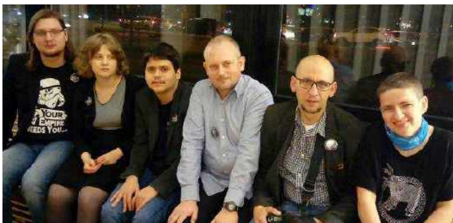
Zespół Spółdzielni Socjalnej FURIA

Naszymi do wiadzeniami i rozwi zaniami ch tnie dzielimy si ze wszystkimi zainteresowanymi podczas wizyt studyjnych, szkole , warsztatów oraz wyst pie na spotkaniach i konferencjach. Nasz model aktywizacji został opisany i opublikowany w formie drukowanej oraz jest dost pny w formie e-broszury. Pracowni Spółdzielni odwiedzaj przedstawiciele organizacji pozarz dowych, instytucji i placówek reintegracyjnych. Doskonale rozumiemy potrzeb poznawania dobrych praktyk, ale zdajemy sobie równie spraw i podkre lamy zdecydowanie, e tworz c przestrze pracy dla osób z niepełnosprawno ciami specjalnymi, zawsze nale y by pionierem, odkrywc – poniewa to, co jest dla ka dego, jest do niczego – kopiowanie rozwi za bez dopasowania ich do potrzeb i mo liwo ci konkretnych ludzi staje si przepisem na nieuchronn pora k . Przyj cie do zespołu nowego pracownika czy goszczenie sta ysty powoduje, e proces adaptacji w rodowisku pracy ka dorazowo rozpoczyna si od podstaw i realizuje przesłanie: poznanie – zrozumienie – akceptacja, by mo liwa była wspólna praca.