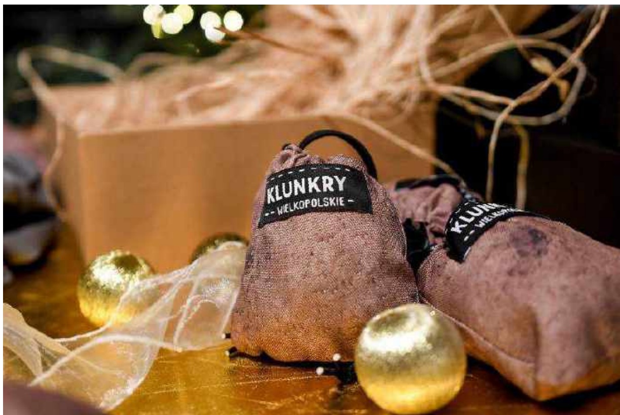
Klunkry Wielkopolskie – torba PYRA

W naszych pracowniach powstaje rodzina profesjonalnie zaprojektowanych produktów, b d cych propozycj dla klientów poszukuj cych praktycznych i wysokojako ciowych upominków z Wielkopolski. FURIA szyje dla marki torby PYRY, wykonuje breloki i magnesy z PYRAMI i KOZIOŁKAMI oraz haftowane filcowe okładki na zeszyty i ksi ki. Jeste my dumni, e dystrybucja „klunkrów” za po rednictwem sklepu internetowego została powierzona naszej spółdzielni. Pakowanie i nadawanie przesyłek to zadania, które nie tylko pozwalaj uzupełni bud et przedsi biorstwa, ale – co nie mniej wa ne – daj okazj do społecznej rehabilitacji i nabywania nowych kompetencji przez naszych pracowników z autyzmem.