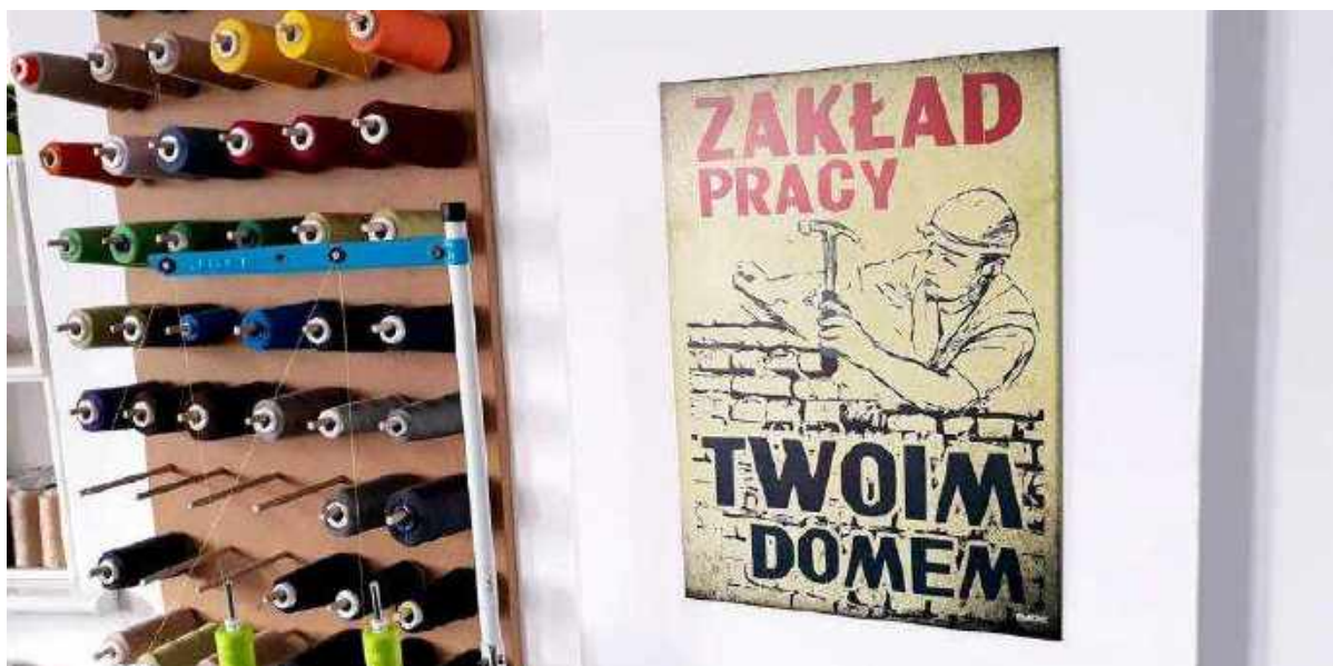
Poznańska pracownia Spółdzielni Socjalnej FURIA

W tamtych latach wielokrotnie zadawali my sobie pytania: dlaczego tak się dzieje? Dlaczego wśród uczestników naszych zajęć dostrzegamy weteranów aktywizacji zawodowej – osoby, które z „sukcesem” ukończyły dwa lub trzy takie projekty i deklarowały chęć udziału w kolejnych? Projekty – taka zabawa w pracę – zaczynały się, trwały i kończyły, jednak ich finałem nigdy nie była prawdziwa praca, nie był nawet staż... a z czasem zacierало się nawet oczekiwanie przyszłego zatrudnienia u wszystkich aktorów tej projektowej przygody. Co stało na przeszkodzie? Wiarygodna z punktu widzenia naszych doświadczeń – jako terapeutów i rodziców – wydawała się jedynie argumentacja najbardziej praktyczna i przyziemna, czyli ekonomiczna.