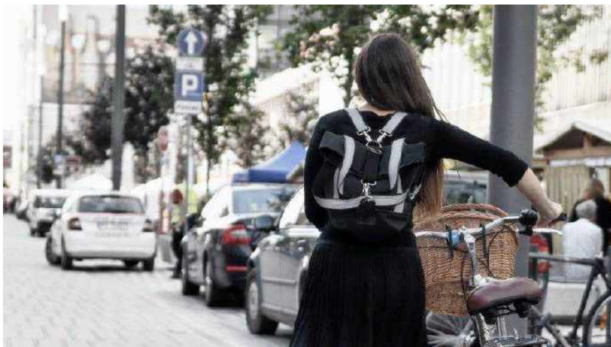
Smartka – odblaskowy plecak testowany przez poznańskie rowerzystki

Dzi w Spółdzielni Socjalnej FURIA pracuje siedmioro pracowników. Różni nas prawie wszystko: wiek, poziom szeroko rozumianej sprawności, ciekawości edukacyjna i ostateczne wykształcenie. Większość członków naszego zespołu to osoby w spektrum autyzmu – wszyscy są z nami od początku i deklarują kontynuację zatrudnienia – czworo to osoby z orzeczoną znacznym lub umiarkowanym stopniem niepełnosprawności. Mamy różne talenty, zainteresowania i pasje, które są wprost wykorzystywane w codziennej pracy i zawsze uwzględniane przy podziale konkretnych obowiązków w ramach danego zlecenia. Razem tworzymy społeczność, która wspiera się w różnych przestrzeniach życia – znamy swoje rodziny, możemy na siebie liczyć nie tylko w pracy, również w innych codziennych wyzwaniach. Pracujemy według zindywidualizowanej siatki godzin pracy, w przestrzeniach uwzględniających nasze organizacyjne, sensoryczne i estetyczne zrealizowane potrzeby. W ramach podejmowanych zleceń dzielimy się obowiązkami tak, by realizowane zadania przynosiły satysfakcję oraz dawały szansę na dalszy rozwój naszych umiejętności i kompetencji.