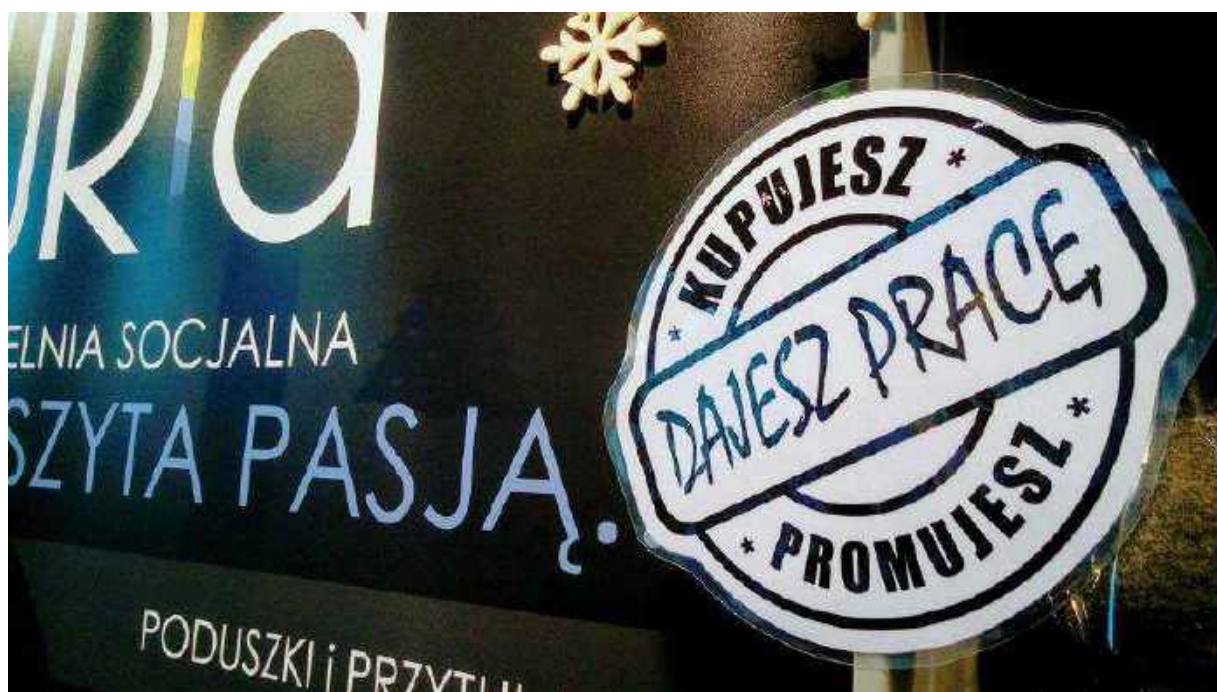
Spółdzielnia podszyta pasją

Za nami już sześć lat działalności Spółdzielni, blisko półtora tysiąca dni i wielokrotnie więcej godzin radości, smutków, zmagania i doświadczeń, które pozwoliły nam znaleźć się bliżej odpowiedzi na kluczowe pytania: jak stworzyć warunki dla skutecznej aktywizacji zawodowej osób z autyzmem? Jak znaleźć balans i optymalnie połączyć potrzeby oraz możliwości naszych pracowników z potrzebami i marzeniami naszych klientów? Dzięki FURIA to fuzja talentów, kreatywnych pomysłów i pasja w działaniu, jednak pierwotną motywacją do powstania przedsiębiorstwa była inna furia – przede wszystkim złość i niezgoda na brak rozwiązań skutecznie wspierających zawodową aktywizację osób w spektrum autyzmu oraz brak „przestrzeni” dla ich efektywnego, trwałego zatrudnienia i wykorzystania w pracy wyjtkowego potencjału autystycznego pracownika.