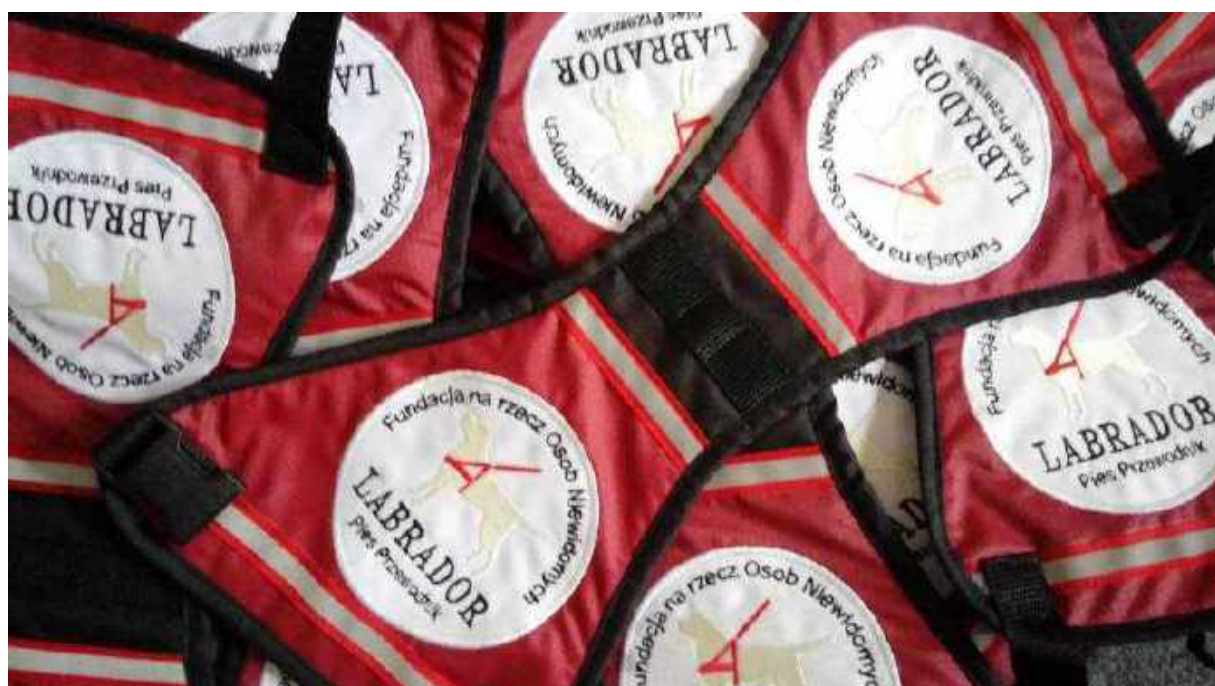
Kamizelki dla psów pracujących wykonane dla Fundacji LABRADOR

Współpracujemy również ze stałymi biznesowymi partnerami, realizując wspólne projekty lub tworząc produkty na ich zamówienie. Na przykład BANERKA jest projektem, który łączy ducha upcyklingu z ideą odpowiedzialnego społecznego biznesu oraz celem charytatywnej inicjatywy (człysty zysk z każdej sprzedanej sztuki dedykowany jest aktywizacji zawodowej osób w spektrum autyzmu). To torba zaprojektowana dla Volvo Firma Karlik, wykonana jest z niepotrzebnych, zużytych już banerów reklamowych oraz odzyskiwanych pasów bezpieczeństwa.