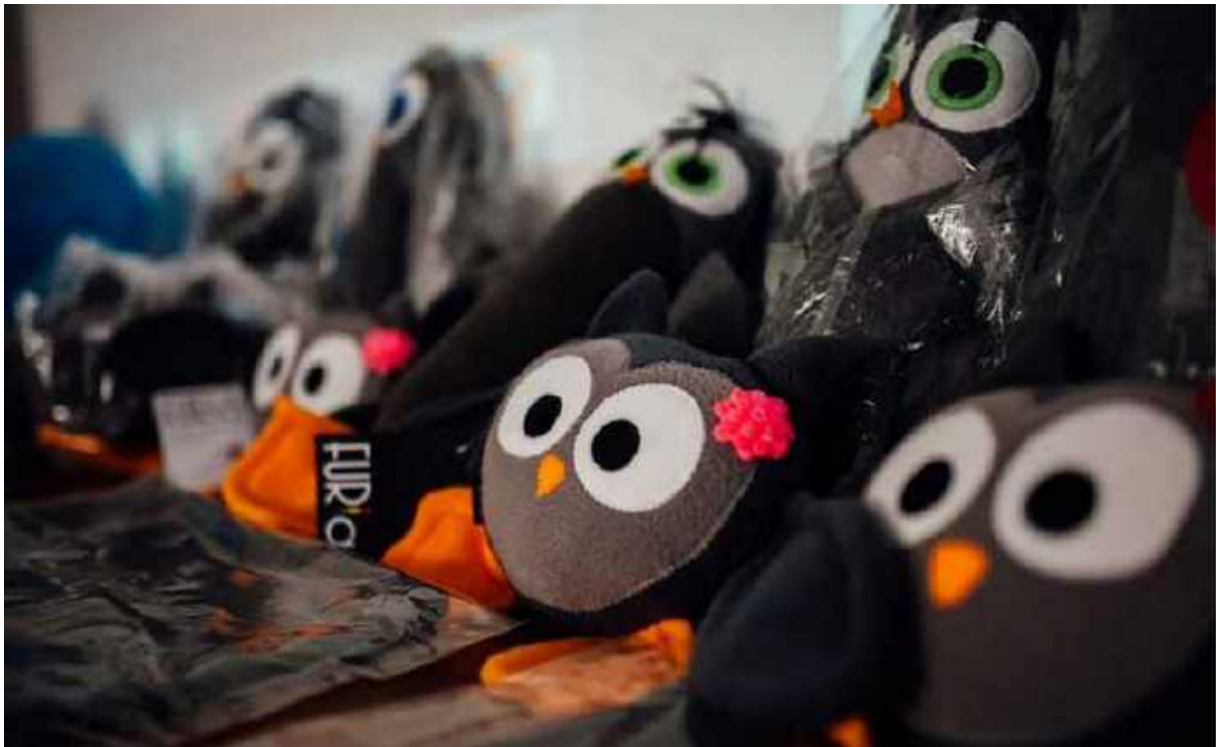
Sowy i inne przytulaszki

Przyczyny takiej sytuacji nie są trudne do zdiagnozowania – wysokie standardy dotyczą ce zarówno warunków pracy, jak i jakości ofertowych produktów i usług nie do końca wpisują się w potrzeby rynku. Nie jesteśmy w stanie konkurować ani z wielkimi szwalniami produkującymi tanio, ani z ekskluzywnymi markami sprzedającymi drogo. Powszechnie odpowiedzialne społeczne wybory konsumentów to jeszcze przed nami przyszłość. Sukcesem może być jednak nazwanie niewłaściwie drogą, jak przeszli my z naszym zespołem. Te wszystkie codzienne do wiadczenia i konsekwentnie niwelowane bariery. Sukcesem jest to wszystko, co nas łączy... czyli FURIA – rozumiana już teraz jako ukierunkowana pasja do działania, rozwijania nas samych oraz naszego wspólnego przedsięwzięcia.