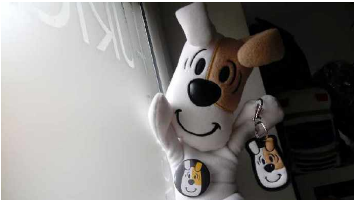
Zestaw gadżetów na 50. rodziny Reksia

Współpracujemy również ze stałymi biznesowymi partnerami, realizując wspólne projekty lub tworząc produkty na ich zamówienie. Na przykład BANERKA jest projektem, który łączy ducha upcyklingu z ideą odpowiedzialnego społecznego biznesu oraz celem charytatywnej inicjatywy (człysty zysk z każdej sprzedanej sztuki dedykowany jest aktywizacji zawodowej osób w spektrum autyzmu). To torba zaprojektowana dla Volvo Firma Karlik, wykonana jest z niepotrzebnych, zużytych już banerów reklamowych oraz odzyskiwanych pasów bezpieczeństwa.