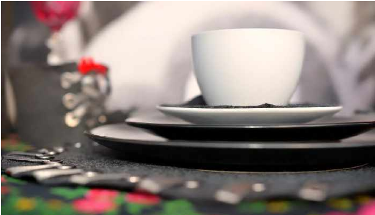
Filcowa dekoracja stołu – Dzień ES w Fundacji Pomocy Wzajemnej BARKA

Jesteśmy równie, jak i grupy Klunkry Wielkopolskie, która od kilku już lat i czy przedstawiciele instytucji działających w obszarze ekonomii społecznej, zdecydowanych, by inwestować w pomoc ludziom do wiadomości, z których trudno ci. Mark, pod skrzydłami Regionalnego Ośrodka Polityki Społecznej w Poznaniu, tworzy wielkopolskie przedsiębiorstwa i organizacje (ZAZ w Pile, Manufaktura Dobrych Usług, Centrum Integracji Społecznej Darzybó, Taka Mydlarnia i WTZ Krzemień z Poznania) zatrudniające osoby z niepełnosprawnościami, z zaburzeniami psychicznymi oraz wychodzące z bezdomności.