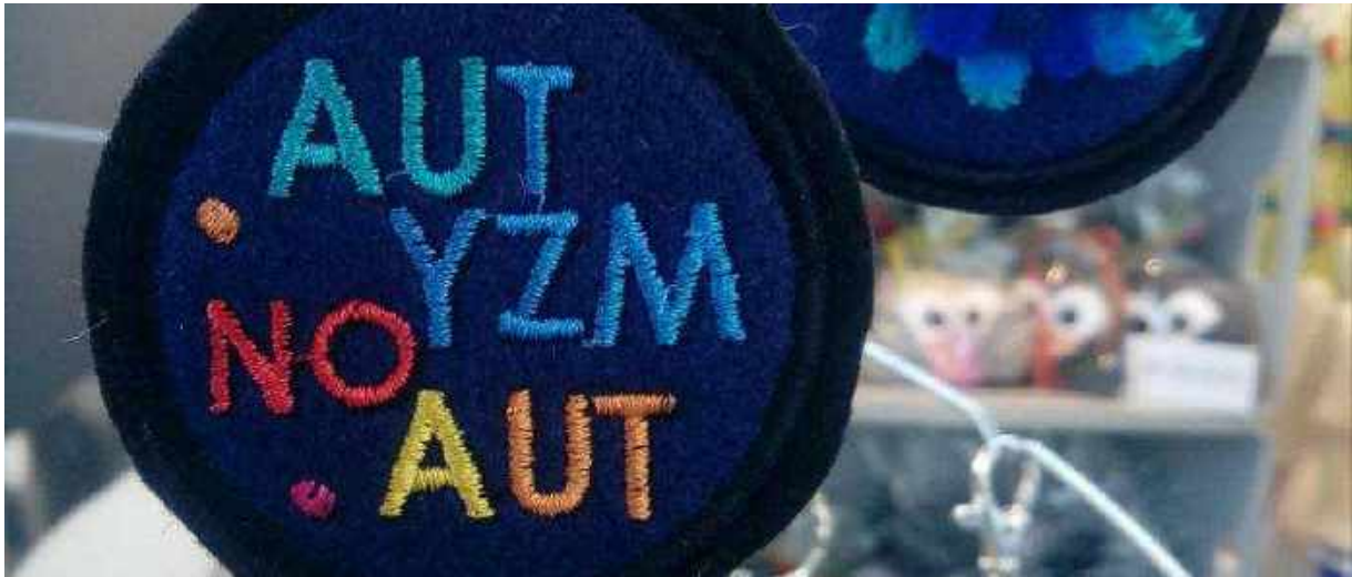
Brelok z haftowanym mottem Fundacji FIONA

Odpowiedź nasuwała się sama: należy gruntownie zbadać problem – nie teoretycznie, lecz empirycznie – i zastanowić się nad remedium. Należy stworzyć miejsca pracy wykorzystujące indywidualne zasoby, talenty tej grupy pracowników oraz zmienić perspektywę, kierując uwagę nie na niepełnosprawność, lecz na skuteczne likwidowanie barier w środowisku pracy.