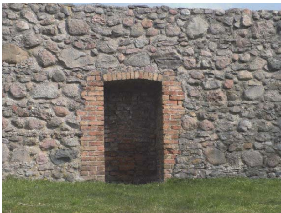
Fot. 8 Stare przejścia w murach w Strzelcach Krajeńskich zostały zamurowane, przez co część miasta została podzielona, a komunikacja między nimi zaburzona. (fot. P. Bagiński).

W planie rewitalizacji Strzelec Krajeńskich uwzględniono sugestie mieszkańców i regionalistów, w efekcie część tych zamurowanych przejść będzie otwartych. Skomunikuje to części miasta przez jakiś czas od siebie oddzielone. Dobudowane zostaną w odpowiednich miejscach chodniki. Otwieranie murów już się częściowo dokonało, zostało zilustrowane na fotografii znajdującej się na stronie tytułowej.