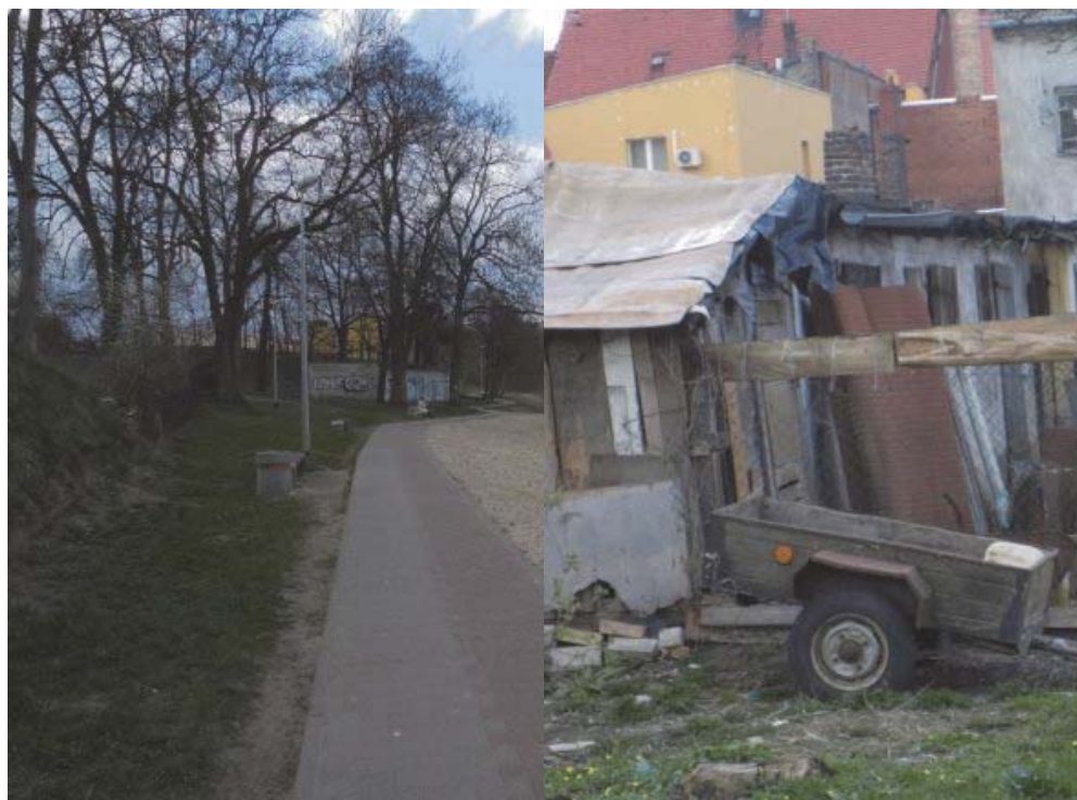
Fot. 18 Jedno z dwóch jezior znajdujących się na terenie miasta jest ciekawym terenem sprzyjającym rekreacji (fot. M. Kwiatkowski). Fot. 19 Z tyłu kamienic, w samym środku miasta, znajduje się sporo takich miejsc, które mieszkańcy zagospodarowali, nie dodają one uroku (fot. M. Kwiatkowski).

SYNERGIA KULTURY, EDUKACJI I ZMIAN INFRASTRUKTURALNYCH – istotnym potencjałem Strzelec Krajeńskich są przedsięwzięcia, które wskazują na możliwe wzajemne powiązanie działań z zakresu kultury i edukacji z trwałymi zmianami w zakresie infrastruktury. Bogata lokalna aktywność kulturalna może być wykorzystana do promocji planowanych i zrealizowanych przedsięwzięć „twardych”. Natomiast oddanie do użytku pomieszczeń na cele edukacyjno-kulturalne może sprzyjać kolejnym twórczym inicjatywom.