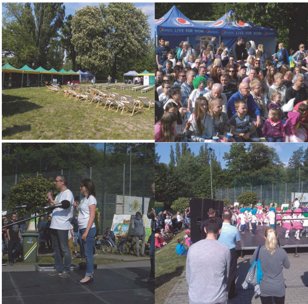
Fot. 10, Fot. 11, Fot. 12, Fot. 13 Piknik konsultacyjny dotyczący Doliny Gęśnika w Zielonej Górze.

Przedstawiciele sektora ekonomii społecznej mogą w wymienionych formach uczestniczyć na takich samych zasadach jak inni mieszkańcy. Mogą także wystąpić z propozycją organizacji lub współorganizacji niektórych z nich. Szczególnie cenne jest uczestnictwo w formach najbardziej interaktywnych (spacer, warsztaty). Na tym etapie zapadają najważniejsze decyzje dotyczące kształtu przyszłej rewitalizacji oraz zakresu jej uspołecznienia.