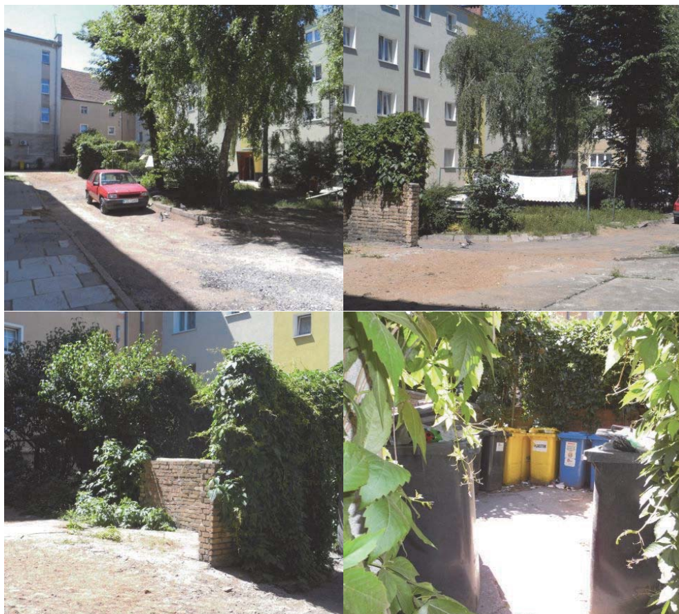
Fot. 1, Fot. 2, Fot. 3, Fot. 4 Przykład zagospodarowania śmietnika i ukrycia go w zieleni pochodzący z jednego ze szprotawskich podwórek.

nia negatywnym efektem spekulacyjnym na rynku nieruchomości i zagrożeniom dla osób gorzej sytuowanych (Kołsut, Ciesiółka, Kudlak 2017: 61).