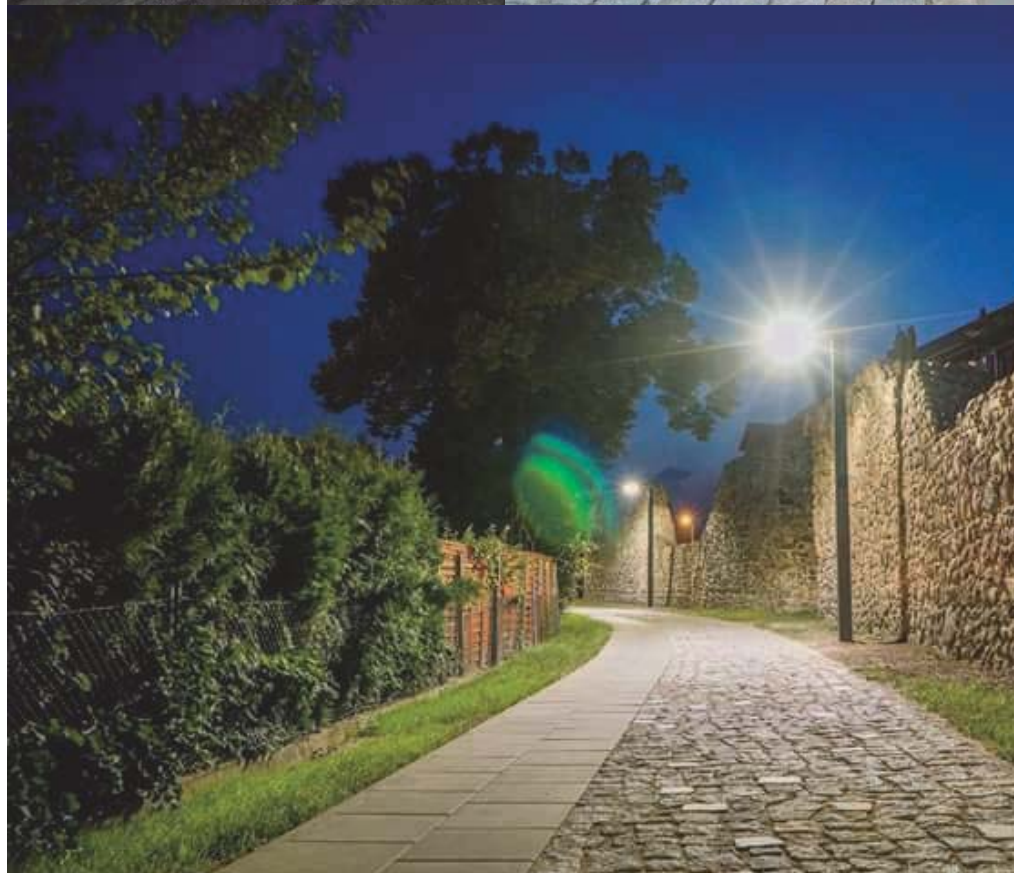
Fot. 15 Mury w Strzelcach Krajeńskich przed rewitalizacją (fot. M. Kwiatkowski). Fot. 16 Mury w Strzelcach Krajeńskich w trakcie rewitalizacji (fot. M. Kwiatkowski). Fot. 17 Część muru w Strzelcach Krajeńskich w zakończeniu procesu ich rewitalizacji. (fot. P. Bagiński).