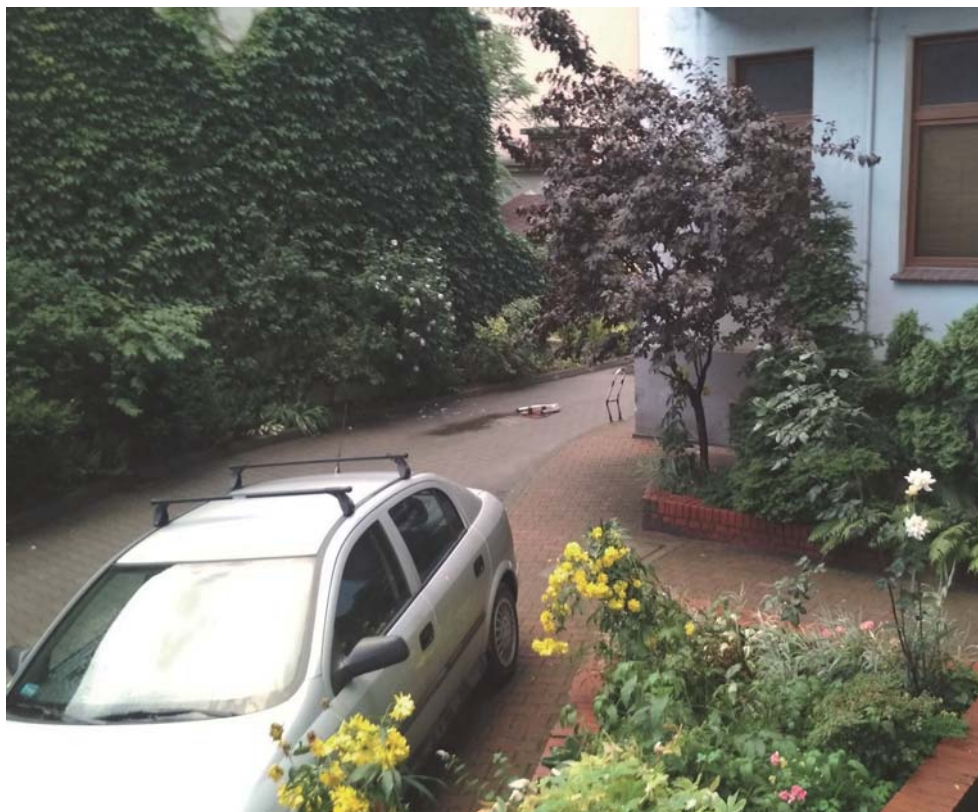
Fot. 5, Fot. 6, Fot. 7 Przykład pozytywnej rewitalizacji podwórka wykonanej przez mieszkańców kamienicy przy ul. Nowowiejskiej na Olbinie we Wrocławiu. Części infrastrukturalne wykonano na koszt wspólnoty, zielen została zasadzona przez mieszkańców. Wąska i nieurokliwa przestrzeń otoczona niezbyt uroczymi murami nabrała innego charakteru. Śmietnik został ukryty za bluszczem.