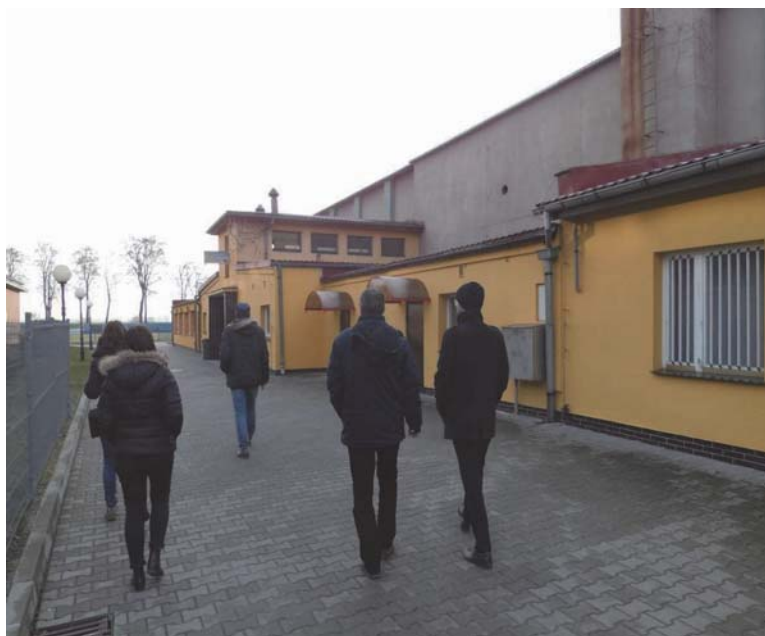
Fot. 9 Spacer badawczy w Krośnie Odrzańskim.

Istnieje wiele form partycypacji w procesie programowania. Część z nich pokrywa się z formami, które są wykorzystywane na etapie diagnozowania. Poniższa lista została ułożona według zasady od form najmniej do najbardziej angażujących mieszkańców: